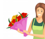
Florist 'flɒrɪst 'flɔːrɪst