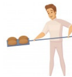
Baker 'beɪkə(r) Pastry chef 'peɪstri ʃef