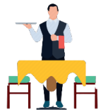
Waiter Waitress 'weɪtə(r) 'weɪtrəs