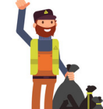
Binman 'bɪnmæn Garbage man 'gɑːbrɪdʒ mæn