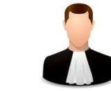
Lawyer 'lɔɪə Attorney əˈtɜːni