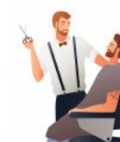
Barber 'bɑːbə 'bɑːbər