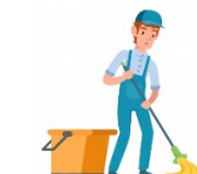
Cleaner 'kliːnə(r) Janitor 'dʒænɪtə(r)