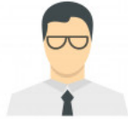
Office worker 'ɒfɪs wɜːkə(r) Employé de bureau